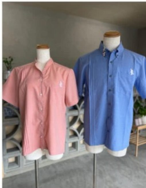
女性(左)はピンク、男性(右)はブルー