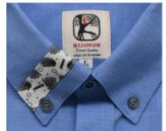
沖縄の妖怪「キジムナー」 「かりゆしウエア」証明タグ