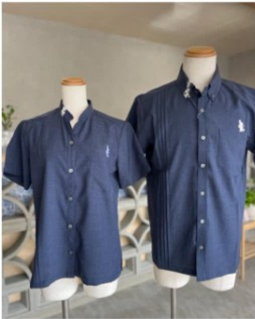
男(右)女(左)兼用のネイビー